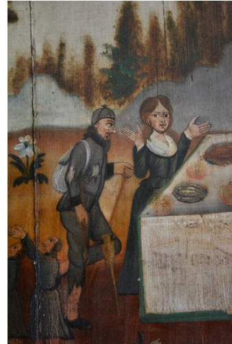
Till höger Bibelns Lasarus, i form av en skogsfinne?