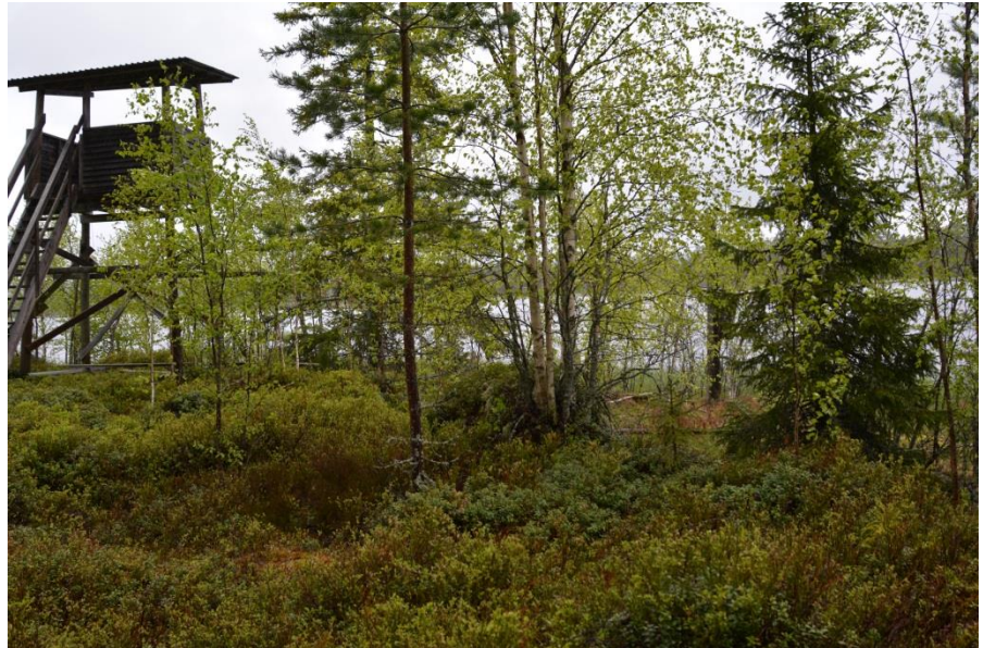
Björnskalleudden