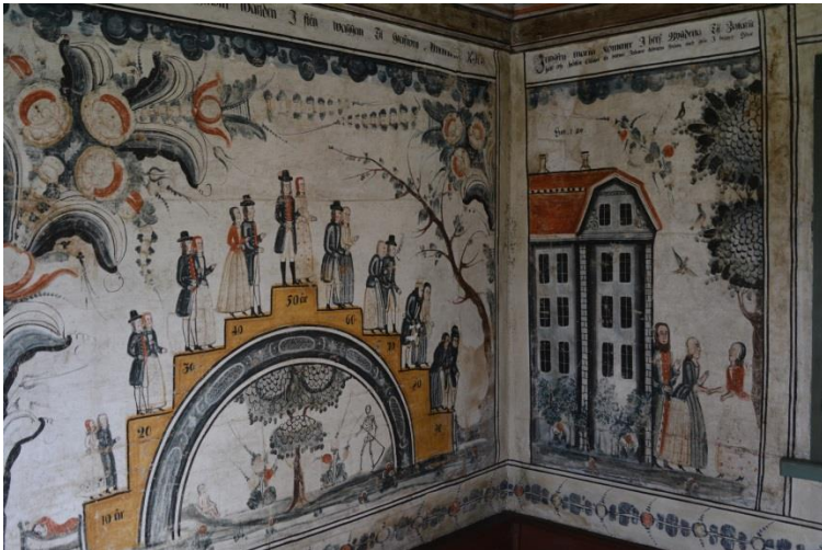
Till vänster Livets trappa.