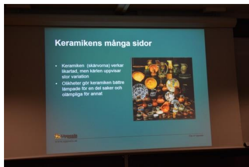
Keramikens många sidor