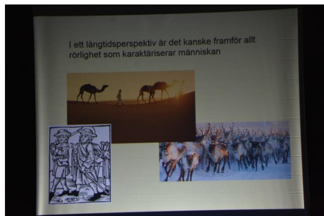
Bilden visar att det kanske är rörligheten som främst karakteriserar människan.

Före middagen kunde de som ville besöka någon intressant plats i byns närhet: Björnskalleudden, Trollstenen eller rian vid Grällsgården. Jag valde Trollstenen där finnen Toivakka enligt sägnen skall ha