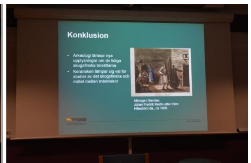
Arkeologin bidrar med infor. om skogsfinsk kultur