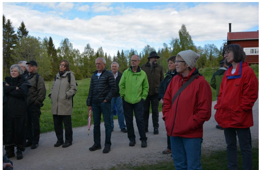
Finnsammare lyssnar intensivt