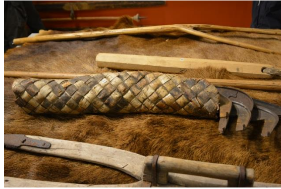
Föremål från Finnskogsmuseet