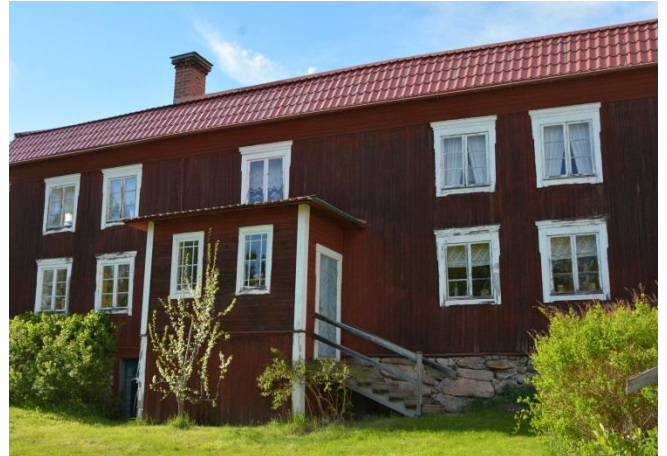
Gårdar i Gullberg, foto Jan-Erik Björk

Dagen avrundades med en god middag på Gläntan och trevlig samvaro där samtalsämnena ofta nog hade skogsfinnsk karaktär.